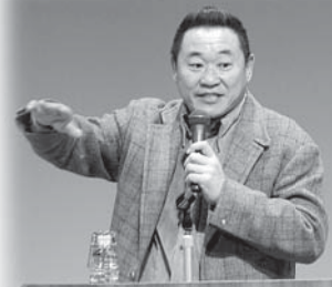
松木安太郎氏講演の様子

おわりには、来る2014年サッカーワールドカップ・ブラジル大会の日本選手を応援してくださいとエールを頂き。今回は、あかるく元気が湧きだす講演会でした。