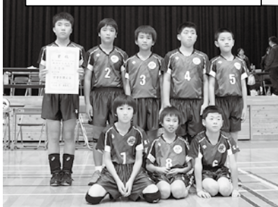
五箇山バレーボール スポーツ少年団