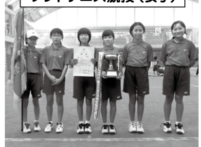
城端ソフトテニス スポーツ少年団A